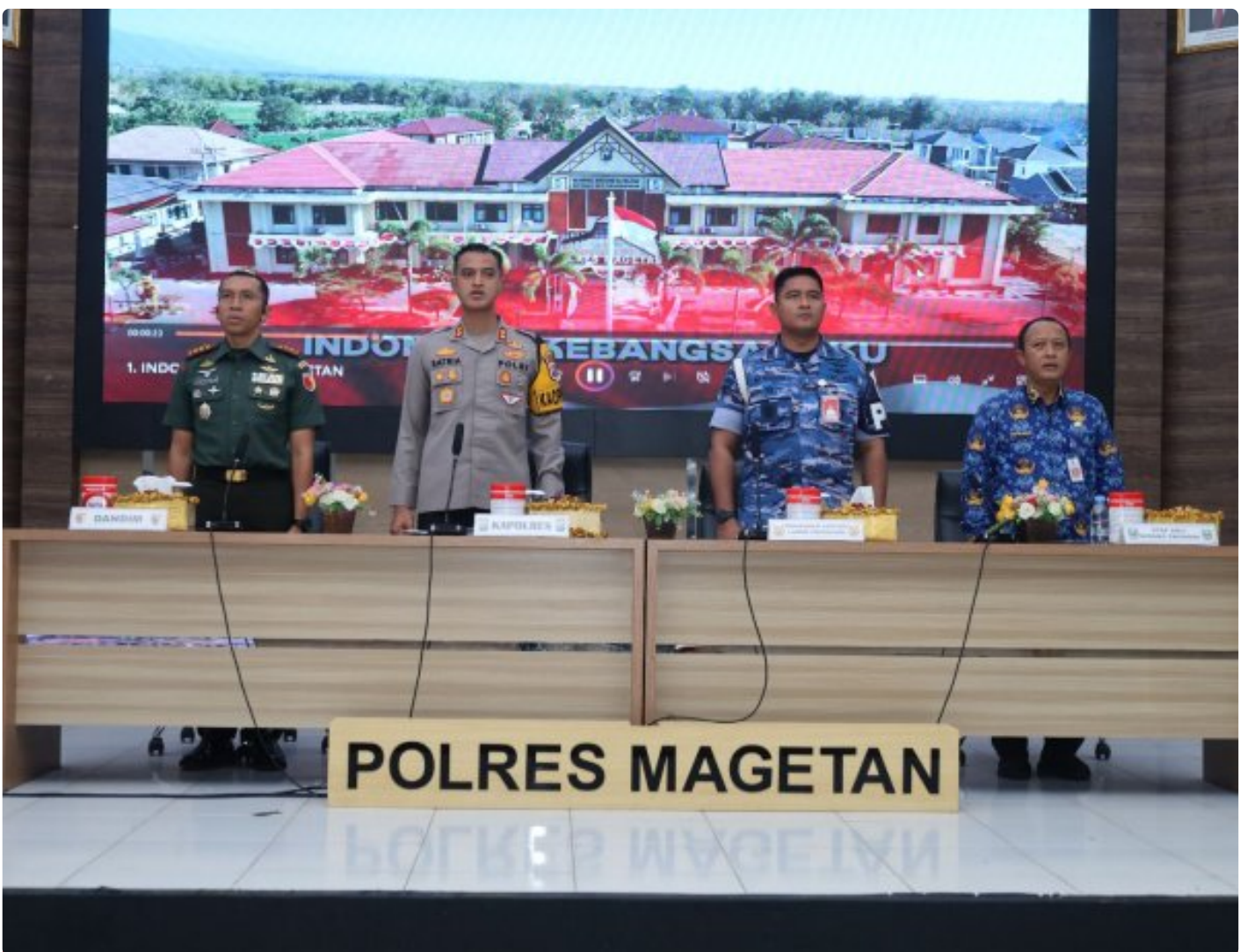
Dandim 0804/Magetan Hadiri Rakor Lintas Sektoral kesiapan operasi lilin 2024

Magetan. – Guna meningkatkan Sinergitas dalam rangka kesiapan operasi lilin 2024 pengamanan Hari Raya Natal 2024 dan Tahun Baru 2025 di wilayah Kabupaten Magetan yang aman dan kondusif.